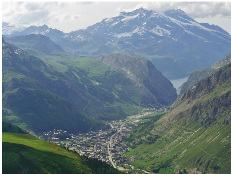
La Savoie, à l'est de la France

Un paysage typique de la Savoie... une région très appréciée des skieurs !